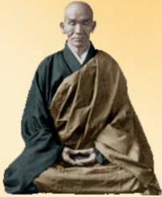
Maître Kodo Sawaki